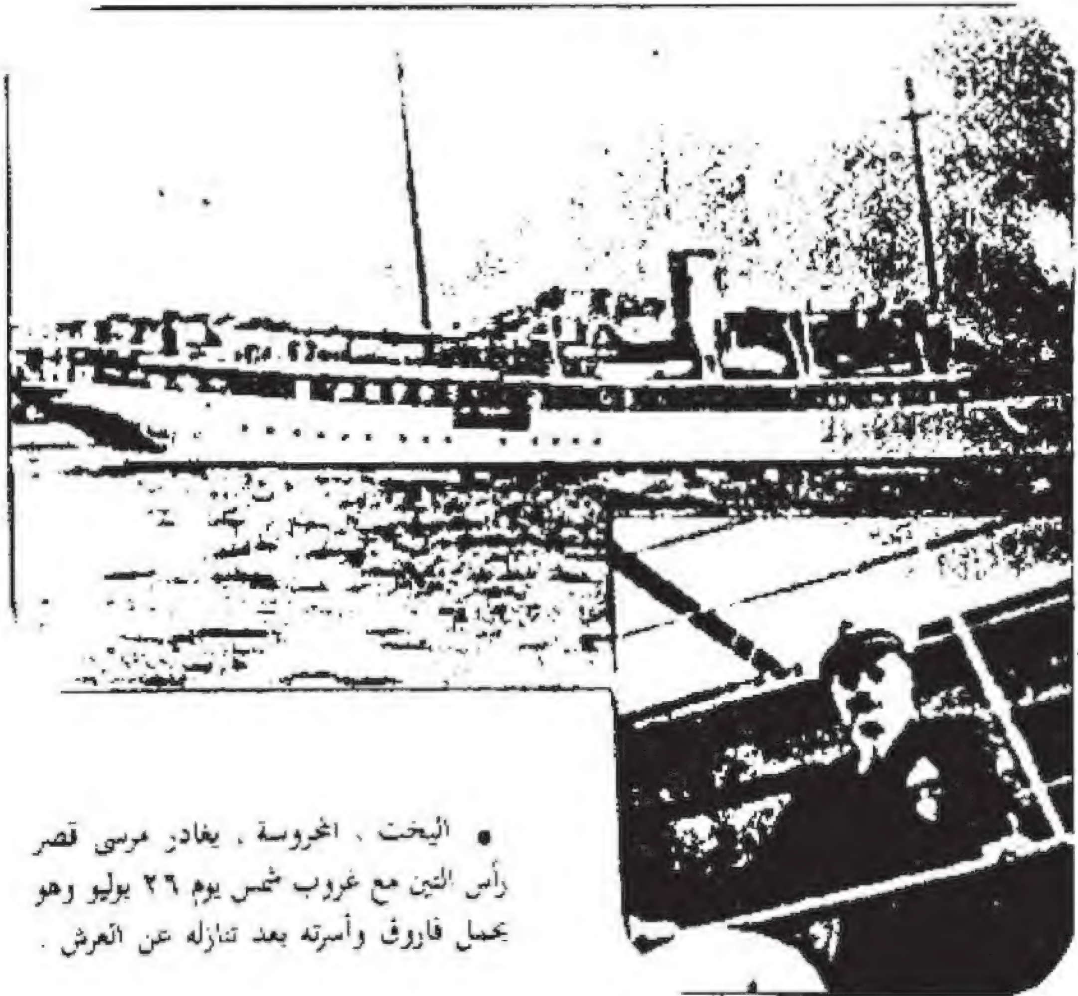
• اليخت ، المخروسة ، يغادر مرسى قصر رأس التين مع غروب شمس يوم ٢٦ يوليو وهو يحمل فاروق وأسرته بعد تنازله عن العرش .

الجماهير في مصر في صمت فالمشهد رهيب حزين ، جميع البواخر الراسية على الميناء منكسة الأعلام وتطلق صفارات الوداع الأخير الحزين ، وكنت في هذه اللحظات التاريخية أرقب هذا المشهد من خلال منظار مكبر بجوار مدفع منكس في